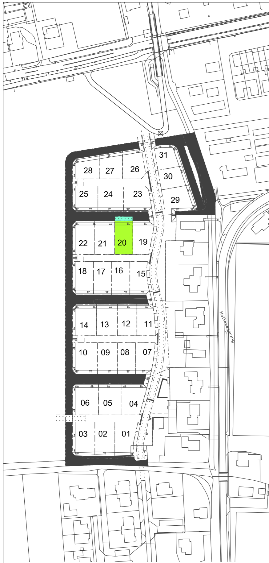
Situatie Schaal 1:2000